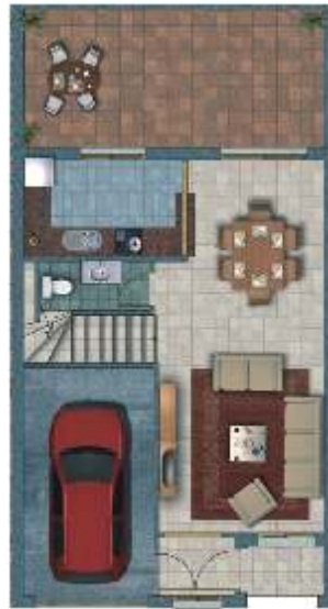
PLANTA BAJA Ground floor

ROYAL VALLEY is perfectly located, just a 20 mins. from Malaga and other important "Costa del Sol" places (Marbella, Fuengirola, ...) close to Golf Courses and in the heart of the "Valle del Guadalhorce" where you will enjoy natural environment and with all facilities at your doorstep.