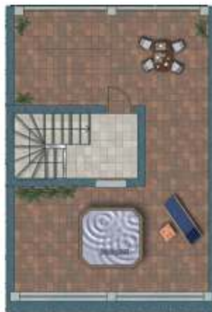
PLANTA SOLARIUM Solarium