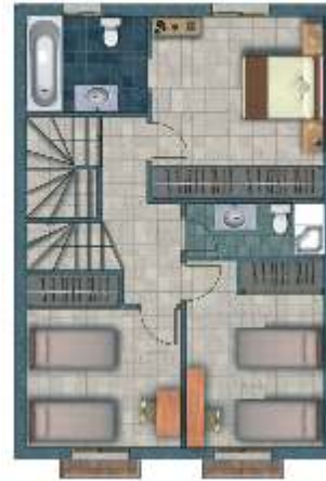
PLANTA PRIMERA First Floor