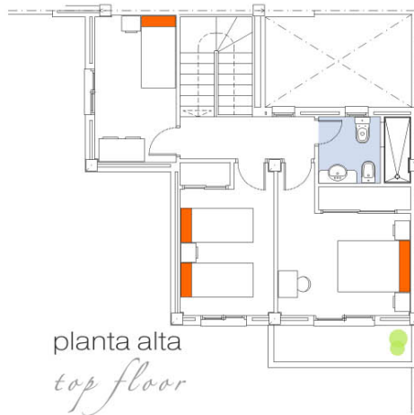
planta alta top floor

Superficie construída planta alta: 50.45 m 2 Superficie construída planta baja: 51.94 m 2 Superficie construída total: 102.19 m 2